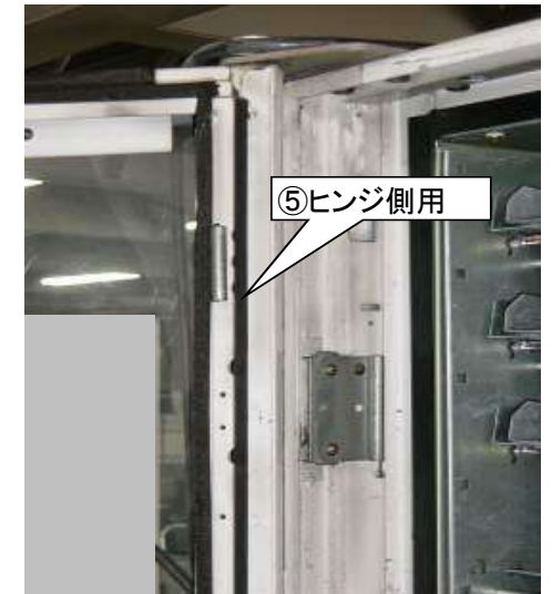
詳細図(上部ヒンジ側)